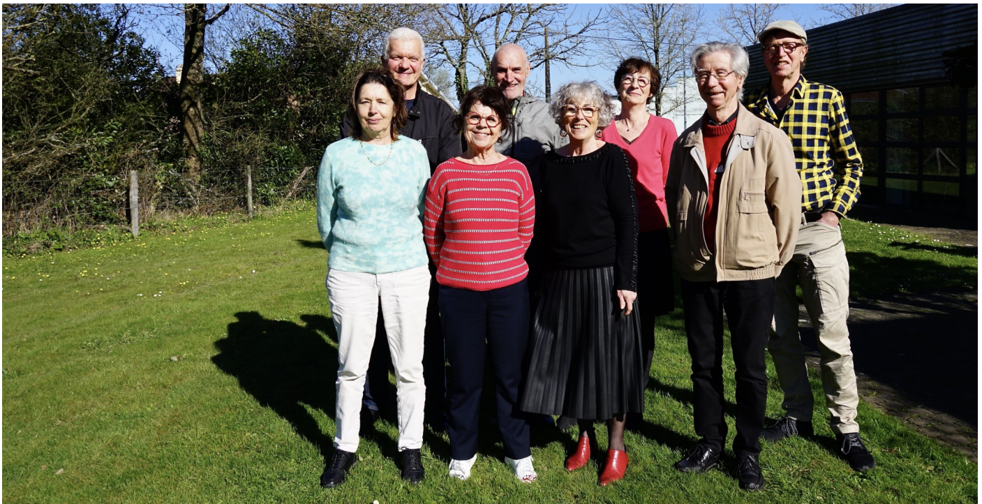
"Tous à l'assemblée générale du 14 juin", c'est le message adressé aux adhérents par les élus de Sésame Autisme (en photo, une partie du conseil d'administration).